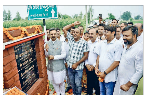
घरौंडा। विकास कार्यों का उद्घाटन करते विधानसभा अध्यक्ष साथ में अन्य।

हरियाणा विधानसभा अध्यक्ष हरविन्द कल्याण ने कहा है कि इलाके की तरावकी के लिए जरूरी है कि सड़कें अच्छी हों। पिछले दस सालों में प्रयास किया गया है कि हलके की सभी सड़कें बेहतर स्थिति में हों। पुरानी सड़कों को चौड़ा किया गया है। इसके अलावा करीब 80 नई सड़कें बनवाई जा चुकी हैं। पुरानी सड़कों को चौड़ा किया गया। करनाल के ताऊ देवी लाल चौक से यमुना तट तक मेरठ रोड को स्टेट हाईवे से नेशनल हाईवे बनवाकर राज्य सरकार ने इस पर करीब 125 करोड़ रुपये खर्च किए हैं। आज यह सड़क प्रगति में योगदान दे रही है। विधानसभा अध्यक्ष हरविन्द कल्याण सोमवार को गांव ऊंचा समाना में रावर दादुपुर रंगारान तक करीब पौने तीन किमी लंबी संपर्क सड़क के उद्घाटन के बाद ग्रामीणों को संबोधित कर रहे थे।