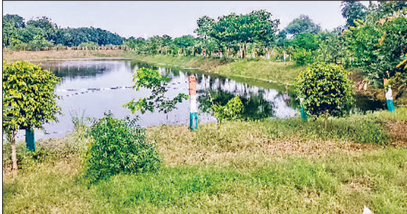
तरावड़ी। गांव में बनाए गए जोहड़ में किया गया जल संचय।

अलावा भी अनेकों मंत्री गांव में पहुंचे हुए हैं। इस व्यवस्था को देखते हुए पूर्व मुख्यमंत्री एवं केंद्रीय ऊर्जा मंत्री मनोहर लाल खट्टर एवं हरियाणा सरकार मुख्यमंत्री नाथ सिंह सैनी ने भी सरपंच के कार्य को देखकर सम्मानित किया है। गांव की सफाई व्यवस्था को लेकर गांव में लोगों को जागरूक करने के लिए जगह-जगह पर दीवारों पर स्वच्छता के स्लोगन पेंटिंग करवाए गए हैं। जिसमें गांव के लोगों का भी सफाई व्यवस्था को लोग लेकर पूरा सहयोग रहता है।