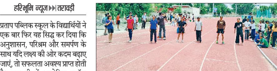
तरावड़ी। प्रताप स्कूल के बच्चों खेलों में भाग लेते हुए।

प्रताप पब्लिक स्कूल के विद्यार्थियों ने एक बार फिर यह सिद्ध कर दिया कि अनुशासन, परिश्रम और समर्पण के साथ यदि लक्ष्य की ओर कदम बढ़ाए जाएं, तो सफलता अवश्य प्राप्त होती है। हाल ही में आयोजित ब्लॉक स्तरीय खेल प्रतियोगिताओं में विद्यालय के छात्र-छात्राओं ने शानदार प्रदर्शन कर अनेक प्रतिस्पर्धियों में जिला स्तर के लिए चयनित हुए। विभिन्न आयु वर्गों में जिला स्तर के लिए अपनी जगह सुनिश्चित की। जिसमें दौड़