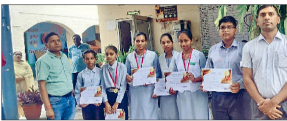
तरावड़ी। स्कूल के विजेता बच्चों के साथ अध्यापकगण।

करनाल। नगर निगम करनाल ने हरियाणा सरकार के निर्देशों पर बेसहारा गौवंश को पकड़ने के लिए विशेष अभियान चला रखा है। उप निगमायुक्त अमर सिंह ने बताया कि 1 अगस्त से प्रारंभ इस अभियान के तहत सोमवार को 13 बेसहारा गौवंश पकड़े गए, जबकि अब तक कुल 38 पशुओं को सुरक्षित पकड़कर फूसगढ़ स्थित गौशाला व नंदीशाला में छोड़ा गया है। उन्होंने बताया कि निगम ने छह स्वस्थ टीम गठित की है और एक विशेष वाहन भी लगाया गया है, जो विभिन्न क्षेत्रों से पशुओं को पकड़कर गौशालाओं में पहुंचा रहा है। वर्तमान में यह अभियान मुख्य सड़कों, सेक्टरों और बाजार क्षेत्रों में चलाया जा रहा है। इसके बाद यह मोहल्लों और आंतरिक इलाकों में भी चलेगा। अमर सिंह ने कहा कि कई लोग दूध निकालने के बाद जानबूझकर अपने पशुओं को सड़कों पर बेसहारा छोड़ देते हैं, जिससे यातायात और स्वच्छता व्यवस्था बाधित होती है और दुर्घटना की आशंका भी बनी रहती है। उन्होंने चेतावनी दी कि ऐसे मामलों में पशु जब्त कर लिया जाएगा और वापस नहीं लौटाया जाएगा, साथ ही कानूनी कार्रवाई भी की जाएगी।