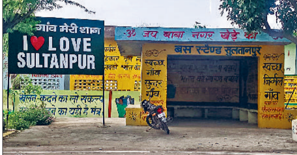
तरावड़ी। गांव का बना बस स्टैंड, उसकी दीवारों पर जागरूकता के स्लोगन।